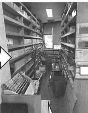
7月末より棚からDVDおよびビデオの撤去作業開始