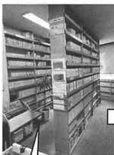
これまでの2階のDVDおよびビデオ展示エリア