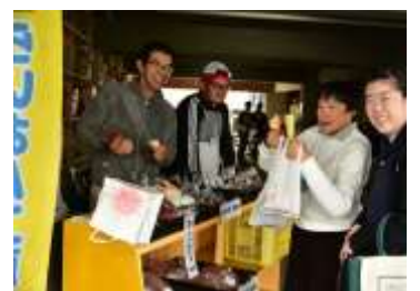
らいおん工房-野菜販売-