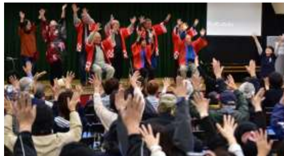
らいおん香取-ズンドコ節で3F会場が一体に