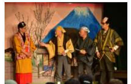
らいおん千葉-水戸黄門！熱演でした。